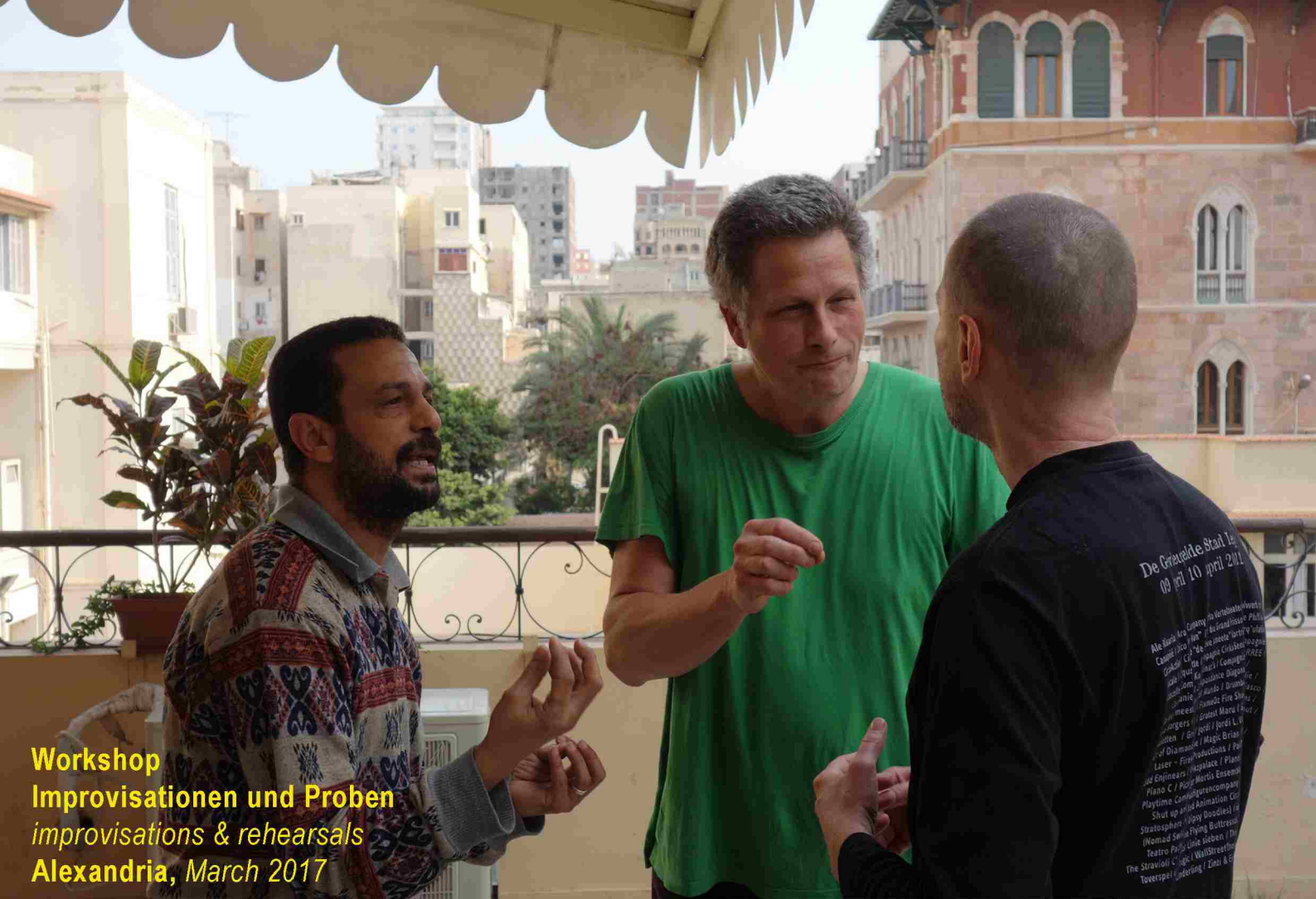
Workshop Improvisationen und Proben improvisations & rehearsals Alexandria, March 2017