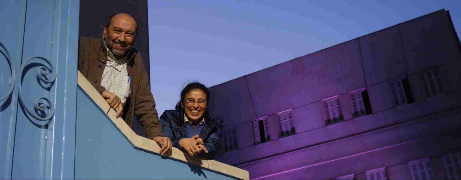
Backstreet Festival Alexandria, Egypt, March 2017 EQUINOX – Workshop Presentation