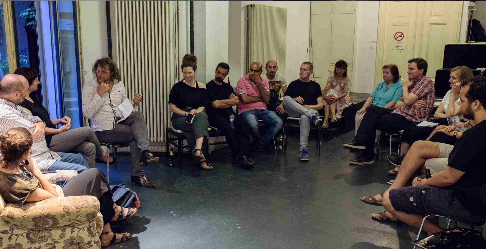
Diskurs „Freie Theater in Berlin und Alexandria / deutsch-ägyptischer Kulturaustausch“