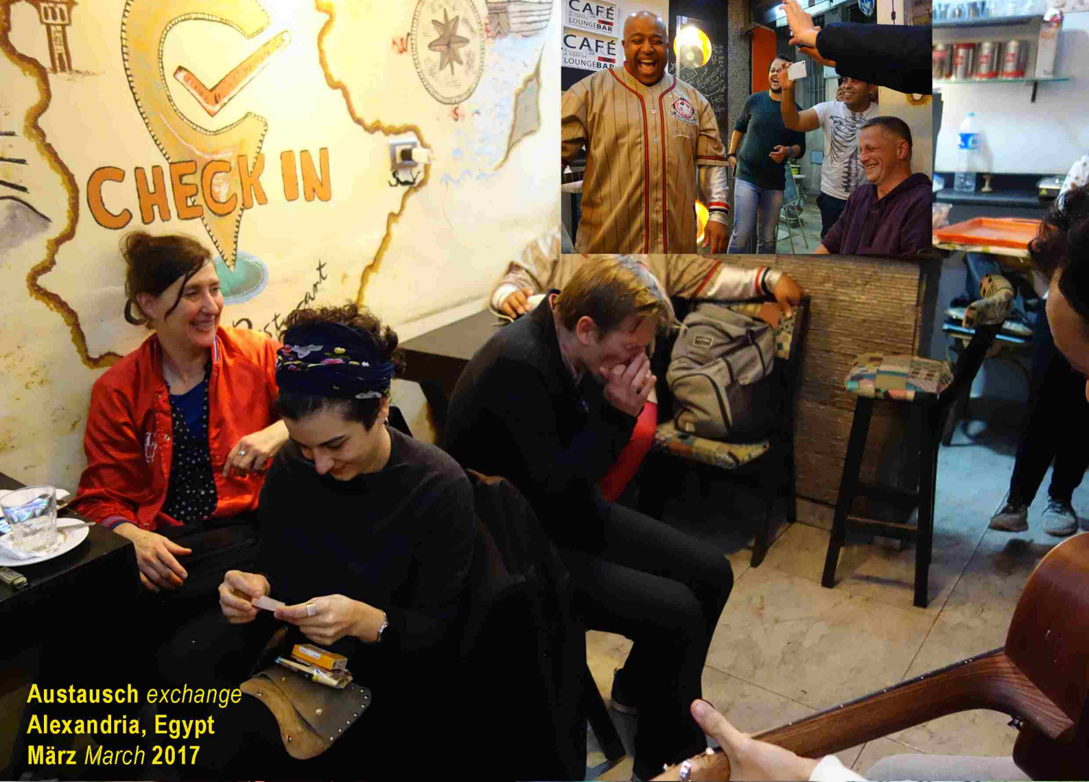
Austausch exchange Alexandria, Egypt März March 2017