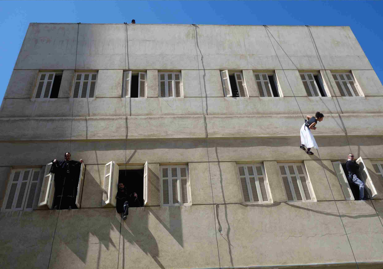
Technische Einrichtungen & Fassadenprobe technical set up & facade rehearsals Alexandria, March 2017